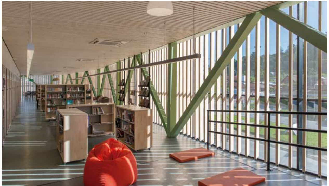
Centro Cultural Arauco (Elton + Léniz, 2016). Vista interior del edificio abierto hacia la calle desde su segundo nivel.