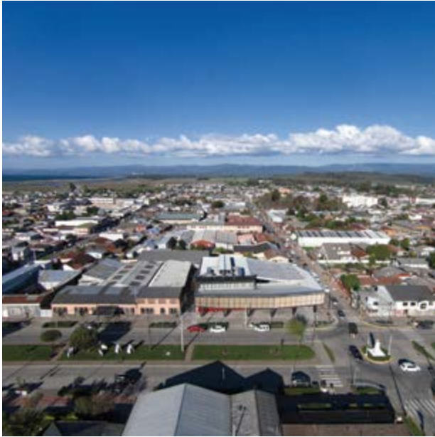
La ciudad de Arauco se expande horizontalmente, limitada por el mar al oeste y las plantaciones al este. En primer plano, el Centro Cultural Arauco (Elton + Léniz, 2016).