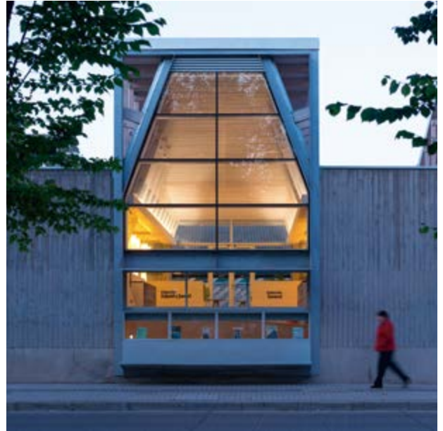
Biblioteca Pública de Constitución (Sebastián Irarrázaval, 2015). La biblioteca mantiene la fachada continua, pero la interrumpe proyectando su interior hacia la calle.