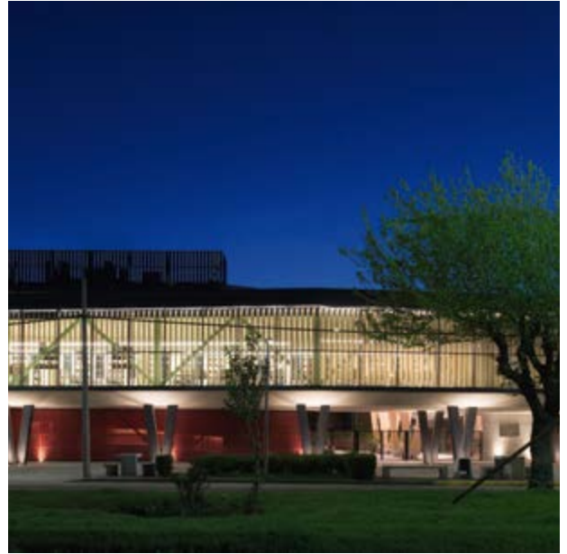
Centro Cultural Arauco (Elton + Léniz, 2016). Por su iluminación pública, el edificio es un hito nocturno en la ciudad.