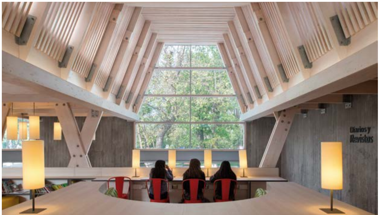
Biblioteca Pública de Constitución (Sebastián Irarrázaval, 2015). Interior enfrentando la Plaza de Armas.