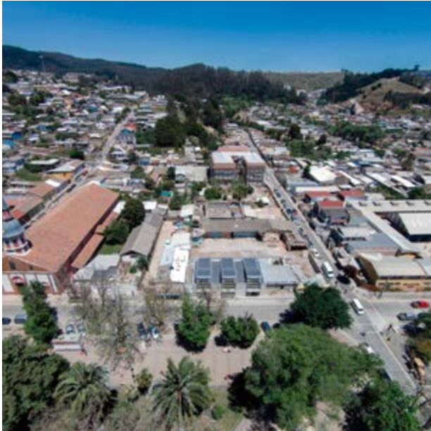
La ciudad de Constitución rodeada de plantaciones exóticas. Frente a la Plaza de Armas y al costado de la parroquia San José, la nueva Biblioteca Pública de Constitución (Sebastián Irarrázaval, 2015) extiende los programas públicos de la vereda.