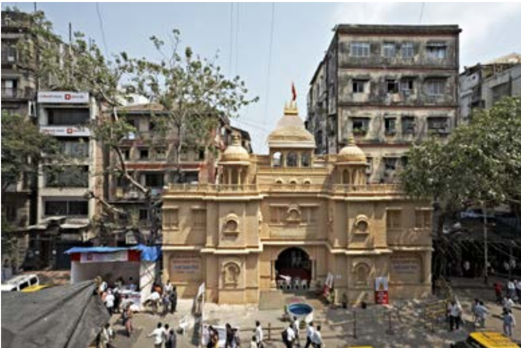
Apropiación temporal de una plaza de Bombay. La ciudad cinética extiende los márgenes de la ciudad estática.