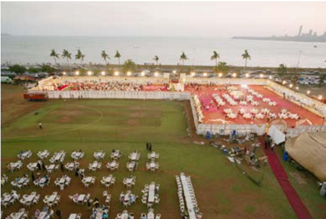
La gente de Bombay transforma las áreas abiertas y genera espacios que desaparecen. El paisaje de temporalidad crea elasticidad en la ciudad.