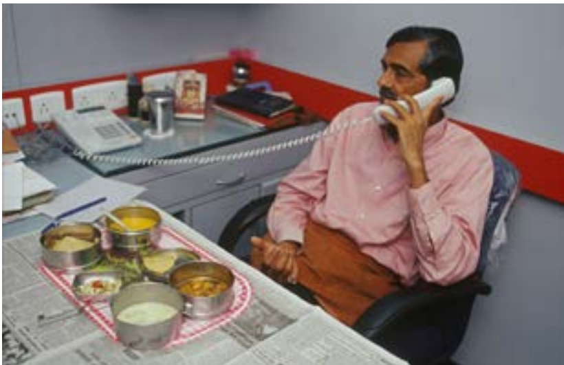
Tres mil personas en Bombay reparten comida informalmente usando estructuras formales como el ferrocarril.