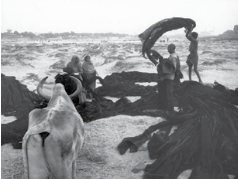
Secando ropa en el lecho del río Sabarmati Fotografía: Henri Cartier-Bresson, 1986; Magnum Photos (Referencia de imagen PAR93913)