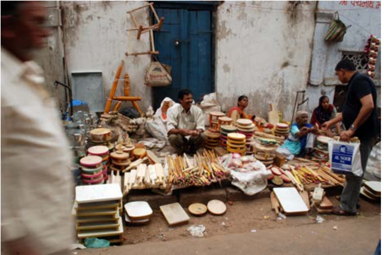
Vendedor de utensilios en el Bazar Gujari de Ahmedabad