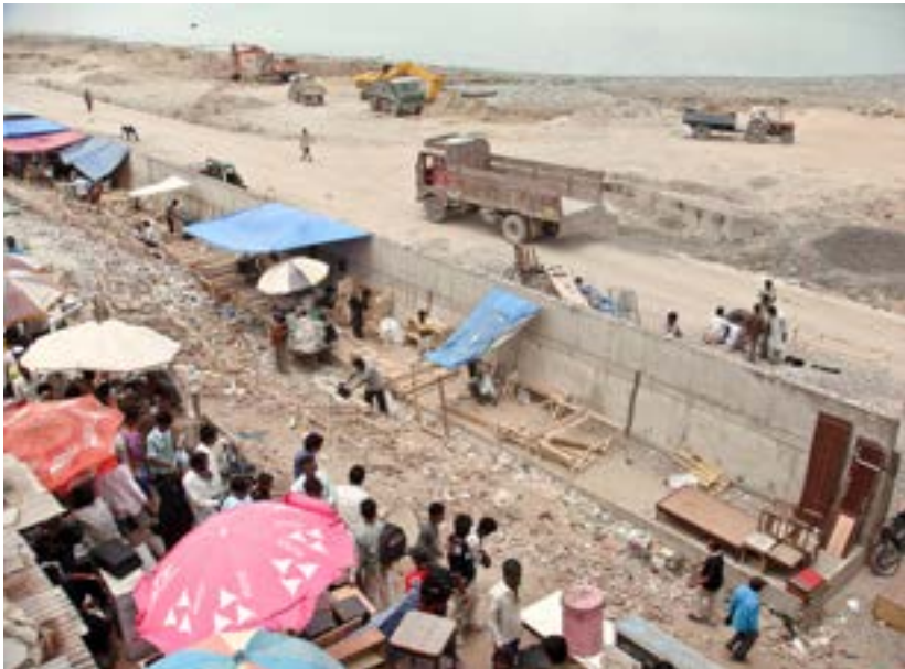
Demoliciones ilegales del Bazar Guajari de Ahmedabad, 2010