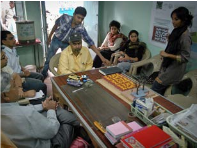
La Asociación Gujari de Ahmedabad se encuentra con el Equipo de Diseño IIM-NID, 2010