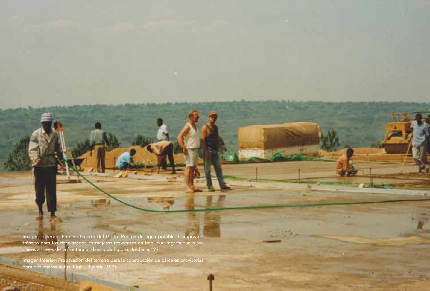
Imagen Inferior: Preparación del terreno para la construcción de cárceles provisionarias para prisioneros hutus. Kigali, Ruanda, 1995.