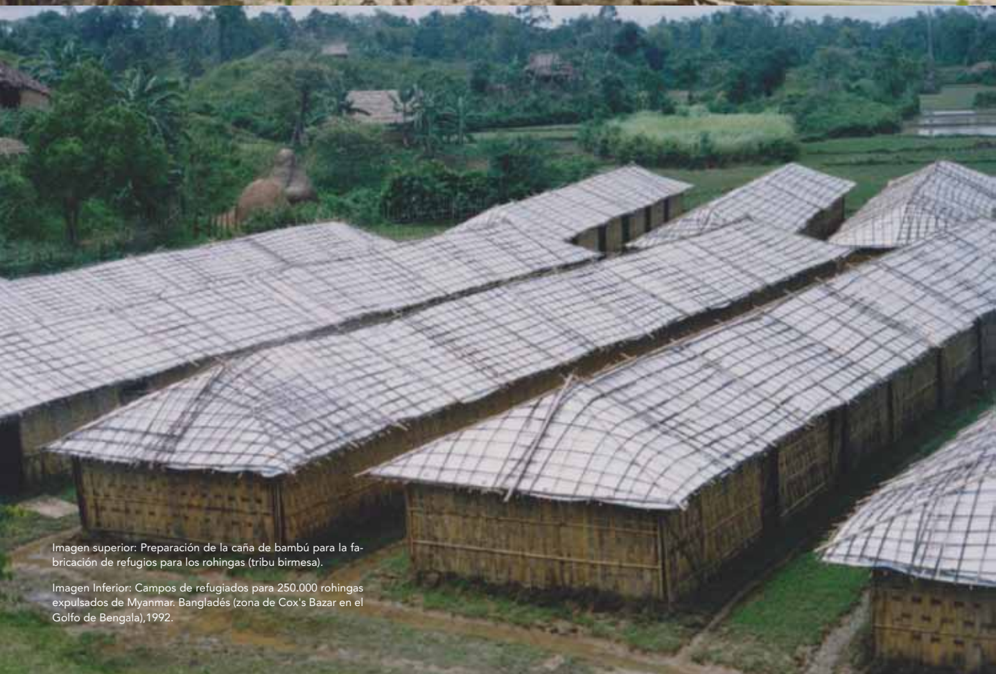
Imagen superior: Preparación de la caña de bambú para la fabricación de refugios para los rohingias (tribu birmesa).