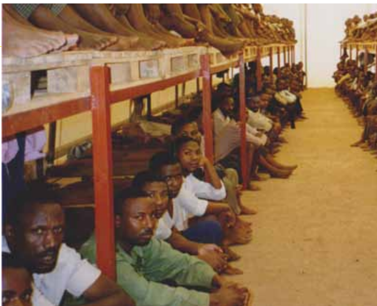
Prisioneros hutus en una cárcel provisoria construida por el Comité de la Cruz Roja Internacional en Kigali, Ruanda, 1995.