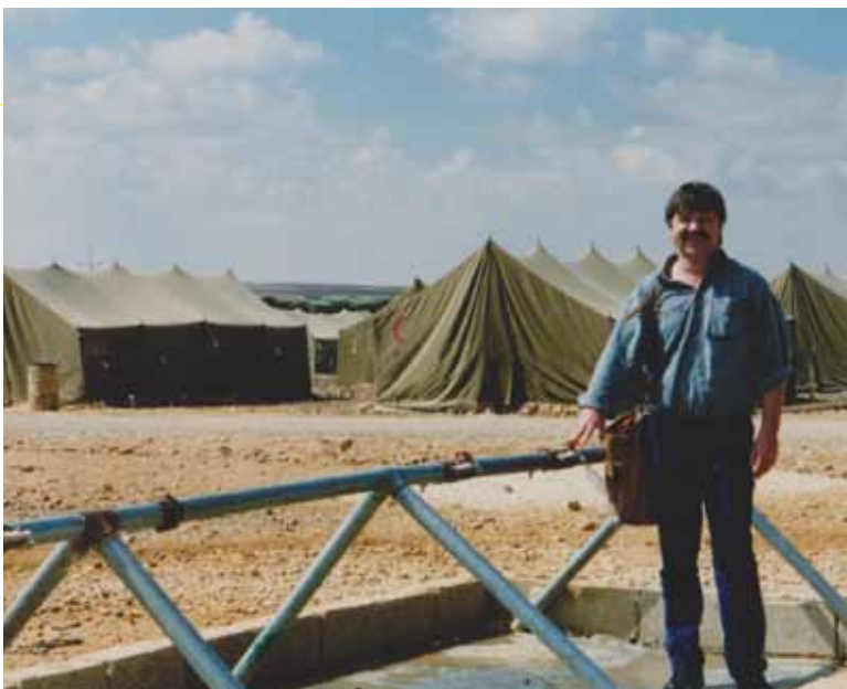
Detalle de un punto de agua potable en construcción para campamentos transitorios.