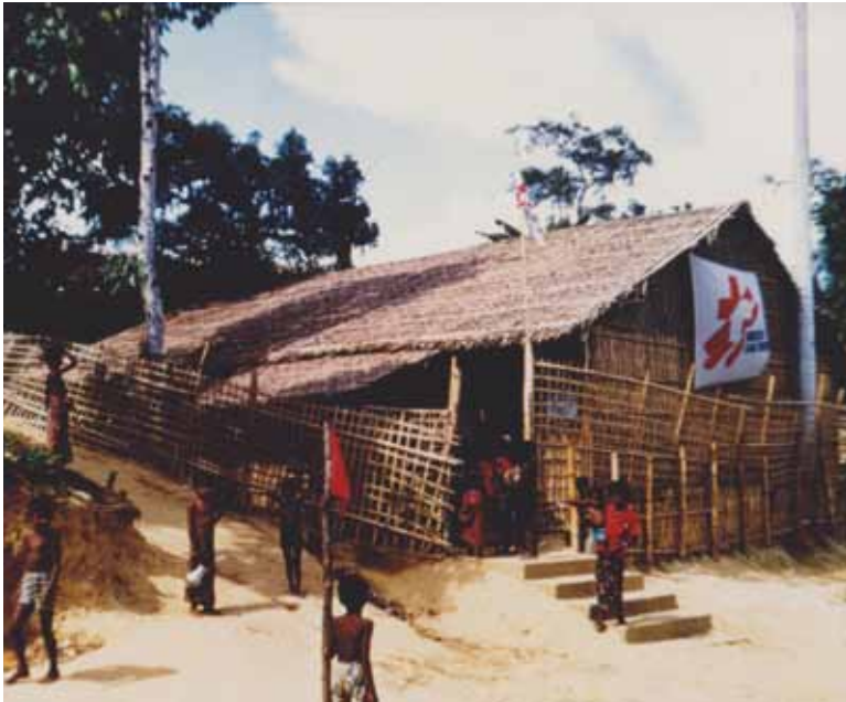
Vista de un barrio en Kigali, Ruanda, 1995.