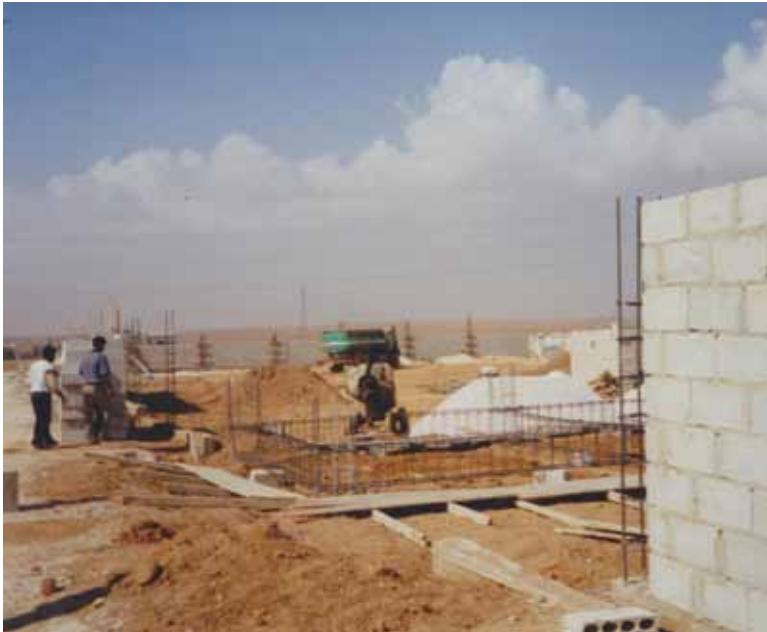
Primera Guerra del Golfo. Campos de tránsito para los desplazados extranjeros residentes en Iraq, que regresaban a sus países a través de la frontera jordana con destino a Amán o Egipto. Jordania, 1991.