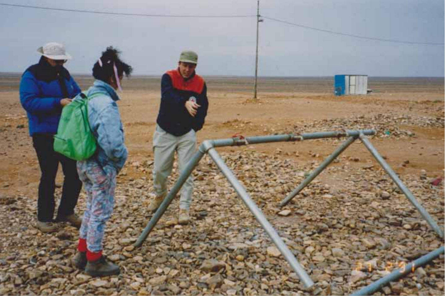
Imagen superior: Primera Guerra del Golfo. Puntos de agua potable. Campos de tránsito para los desplazados extranjeros residentes en Iraq, que regresaban a sus países a través de la frontera jordana y de Egipto. Jordania, 1991.