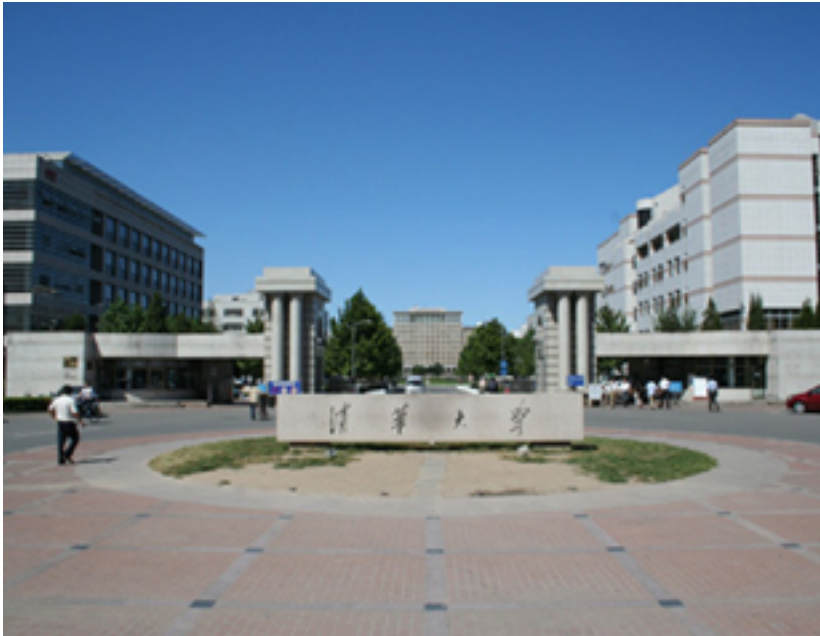
Puerta oficial, Universidad de Tsinghua, Campus Este.