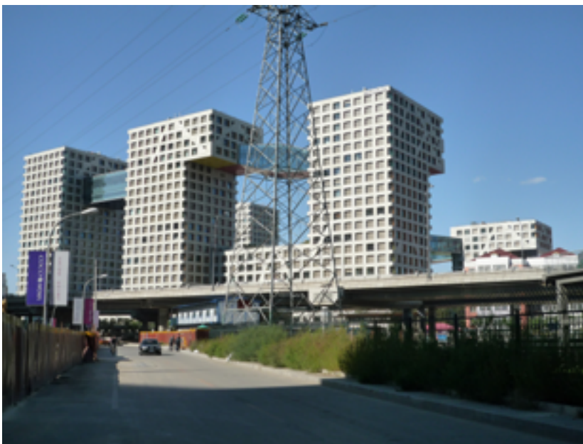
Beijing Hybrid, diseñado por Steven Holl.