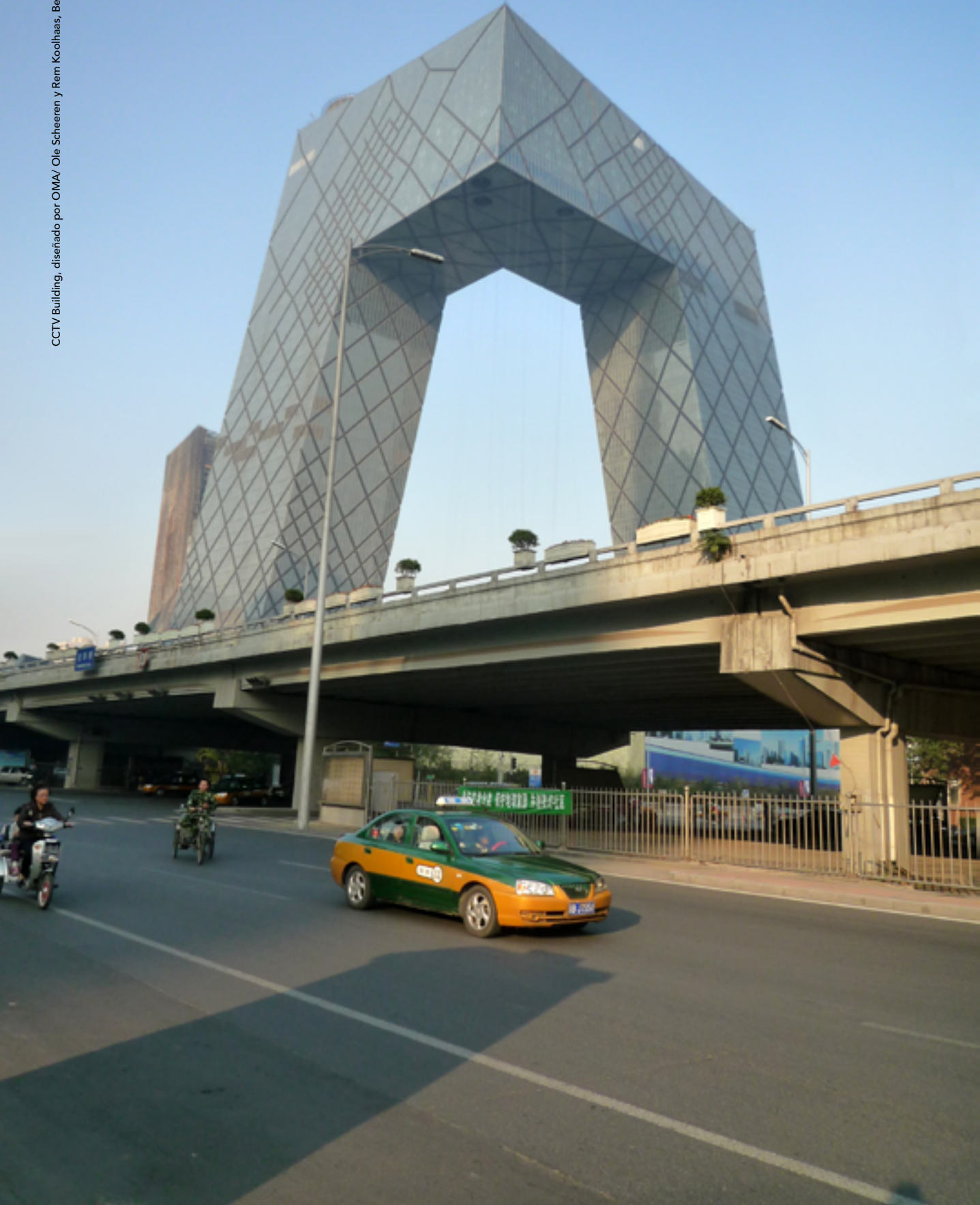
CCTV Building, diseñado por OMA/ Ole Scheeren y Rem Koolhaas, Beijing, China.