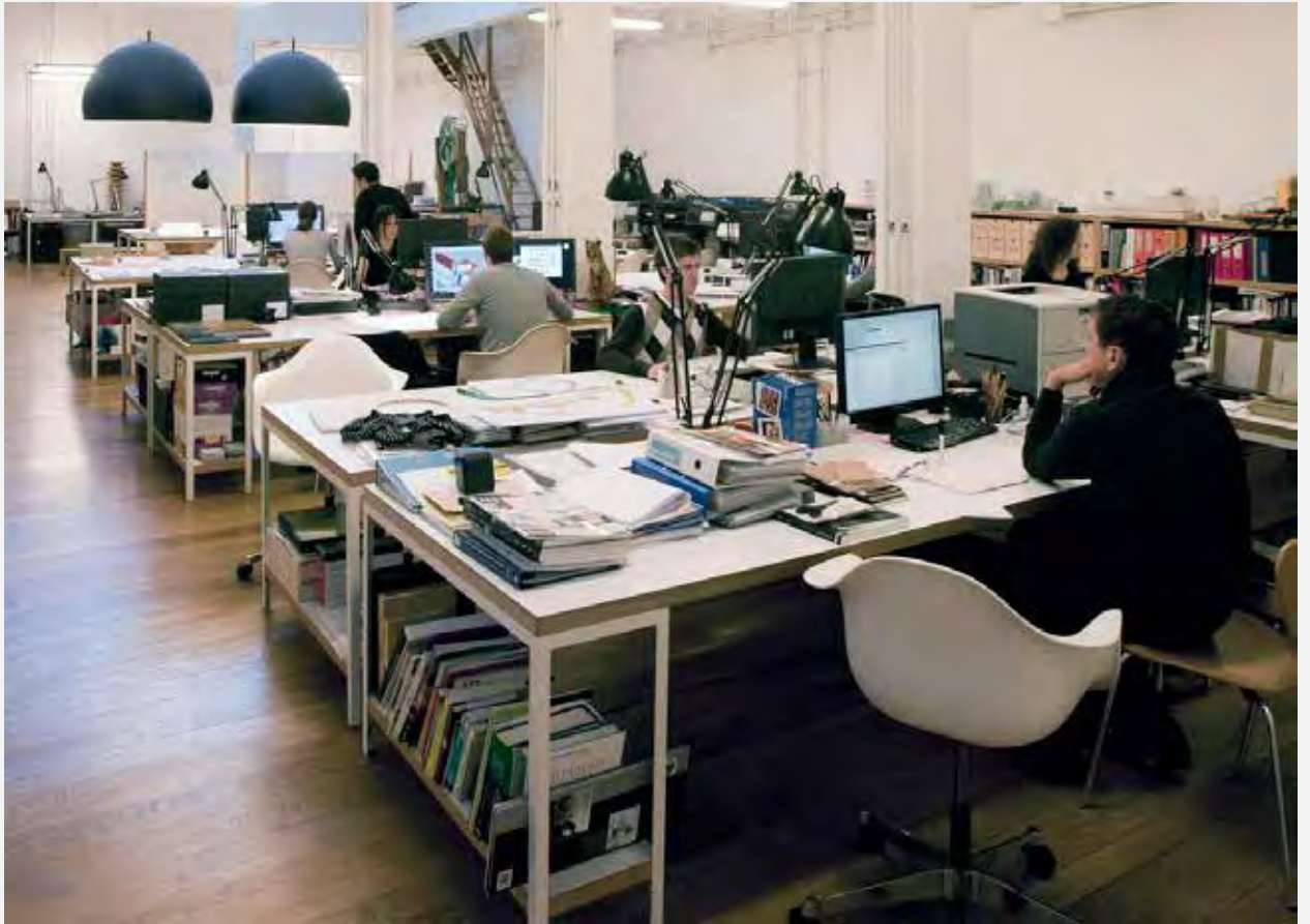
Estudio Mansilla + Tuñón. Mansilla + Tuñón Studio.