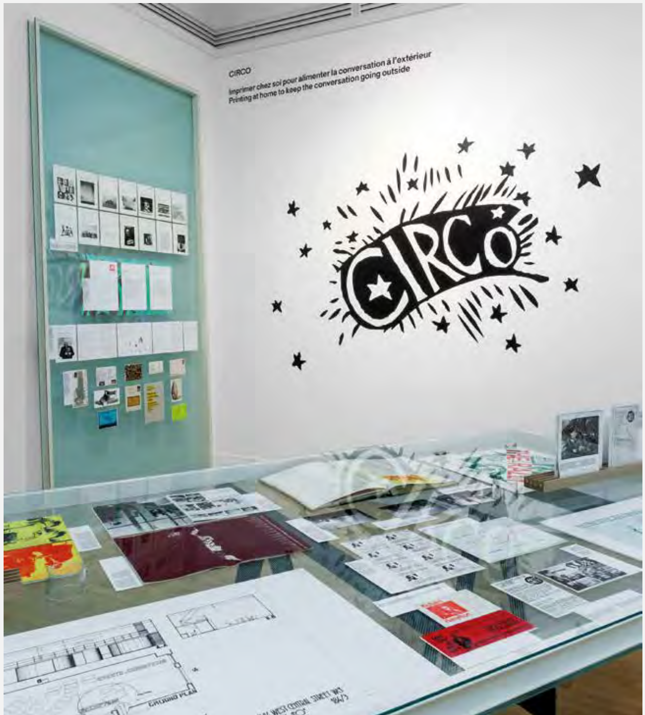
Vista de la instalación de CIRCO en la exhibición "The Other Architect" (Canadian Center for Architecture, Montreal, 2015). View from CIRCO installation in the exhibition "The Other Architect" (Canadian Center for Architecture, Montreal, Canada, 2015).