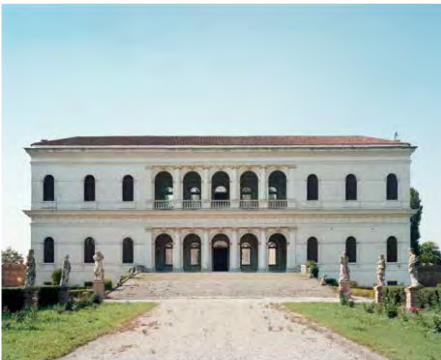
Fachada de Villa Garzoni, Candiana, Italia, 1540 (Arquitecto: Jacopo Sansovino). Fotografía: Bas Princen, 2010. Fuente: San Rocco 00. Imagen cortesía de San Rocco. Façade of the Villa Garzoni, Candiana, Italy, 1540 (Architect: Jacopo Sansovino). Photograph: Bas Princen, 2010. Source: San Rocco 00. Image courtesy of San Rocco.