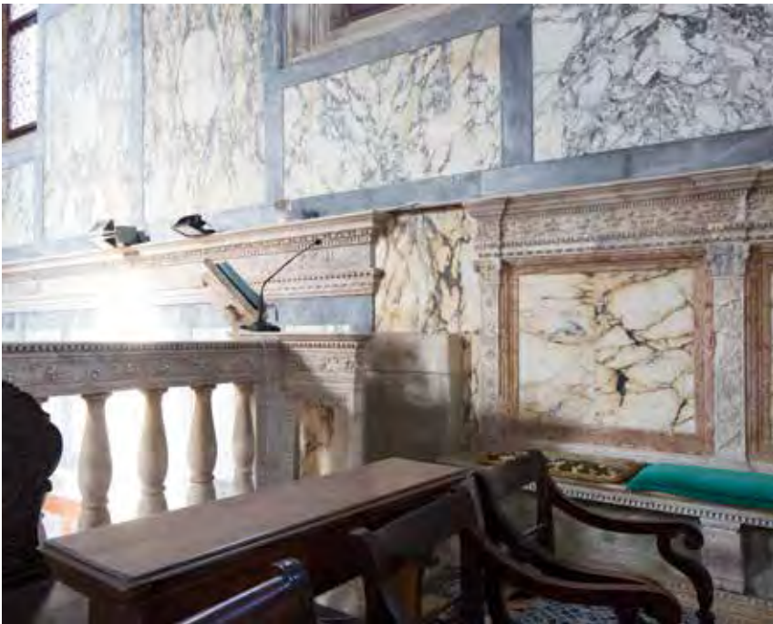
Interior de la iglesia de Santa María de los Milagros, Venecia, Italia, 1489 (Arquitecto: Pietro Lombardo). Interior of the church of Saint Mary of the Miracles, Venice, Italy, 1489 (Architect: Pietro Lombardo).