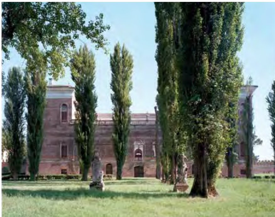
Villa Garzoni, Candiana, Italia, 1540 (Arquitecto: Jacopo Sansovino). Villa Garzoni, Candiana, Italy, 1540 (Architect: Jacopo Sansovino).