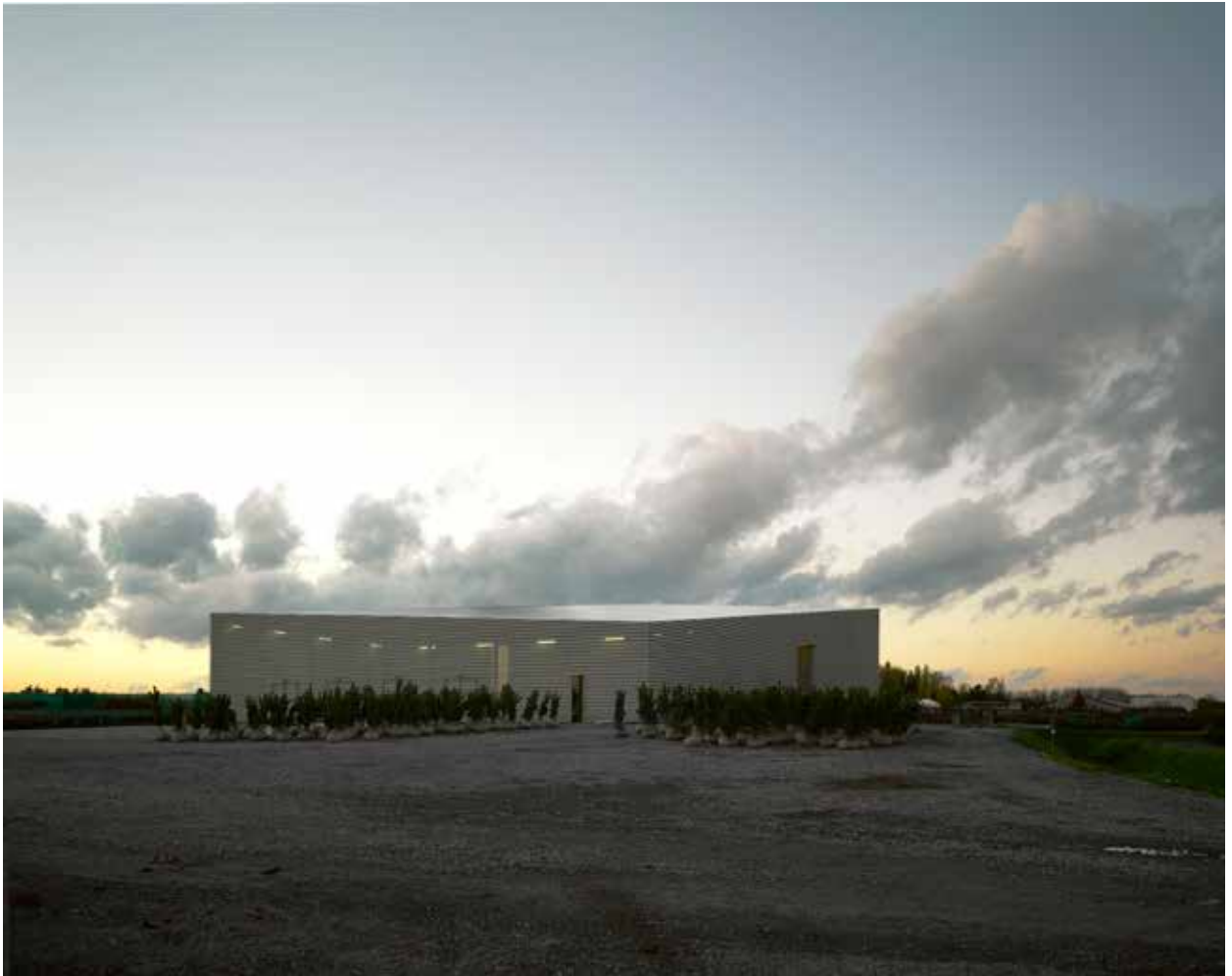
Drying Hall (Office KGDVS, Herselt, Bélgica, 2013). Imagen exterior y contexto de emplazamiento. Drying Hall (Office KGDVS, Herselt, Belgium, 2013). Exterior image and context of location.