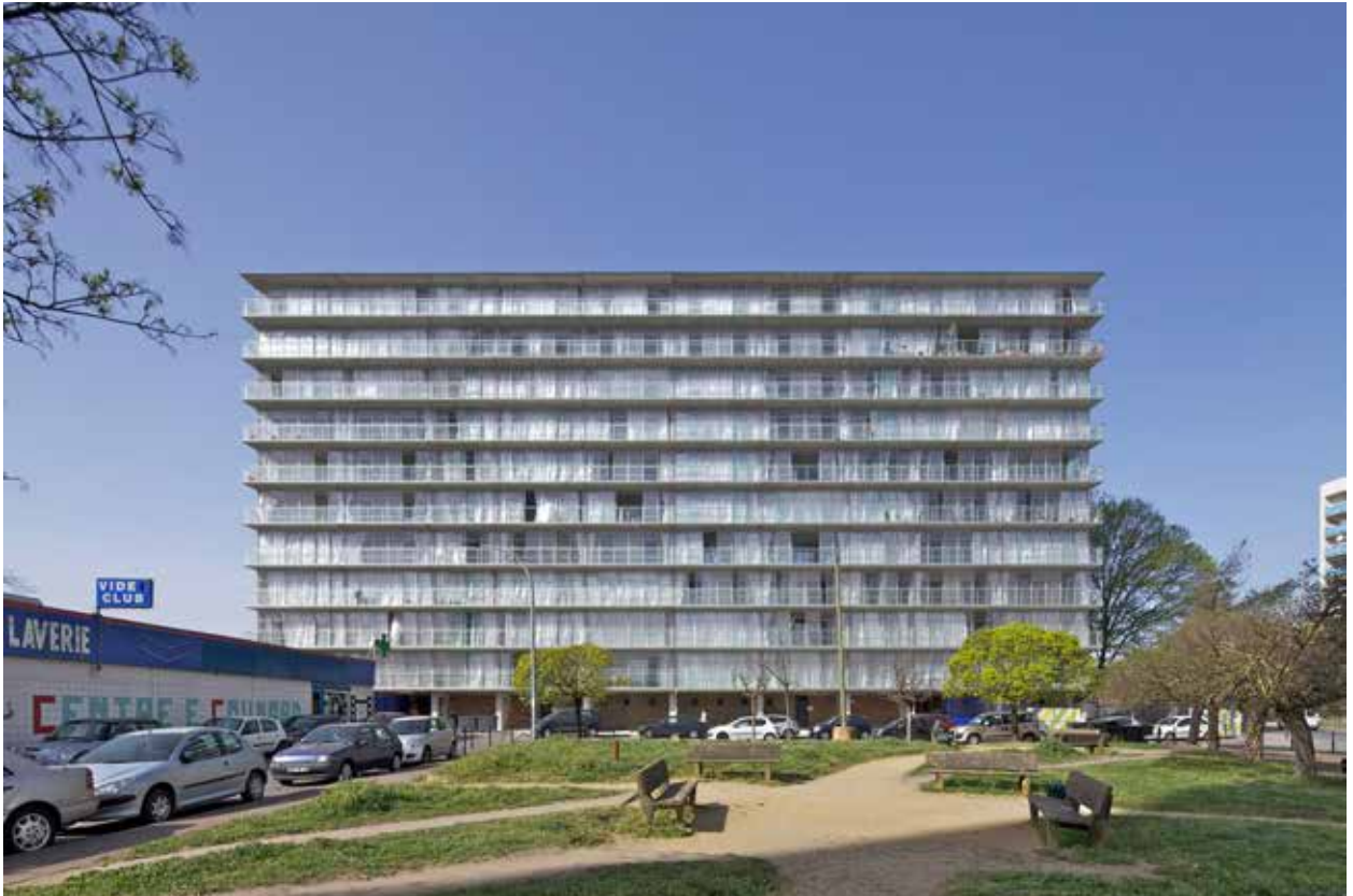
Rehabilitación de edificio de viviendas en Burdeos (Lacaton & Vassal, 2016). Estrategia de rehabilitación. Rehabilitation of a housing building in Bordeaux (Lacaton & Vassal, 2016). Strategy of rehabilitation.