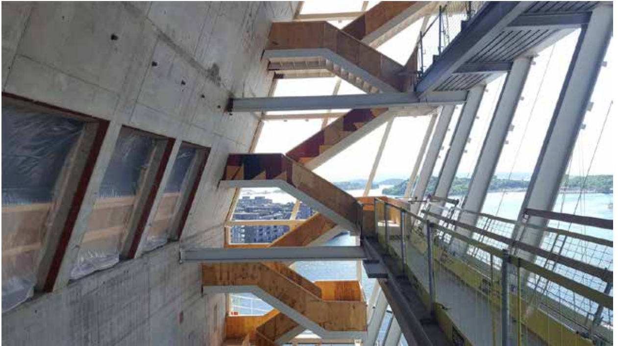
Museo Munch (Estudio Herreros, Oslo, 2018). Edificio en construcción. Munch Museum (Estudio Herreros, Oslo, 2018). Building under construction.