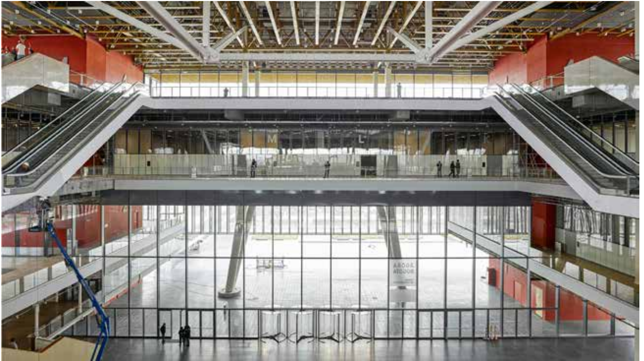
Ágora Bogotá (Estudio Herreros, Bogotá, 2018). Estructura del hall en construcción. Ágora Bogotá (Estudio Herreros, Bogotá, 2018). Structure of the hall under construction.