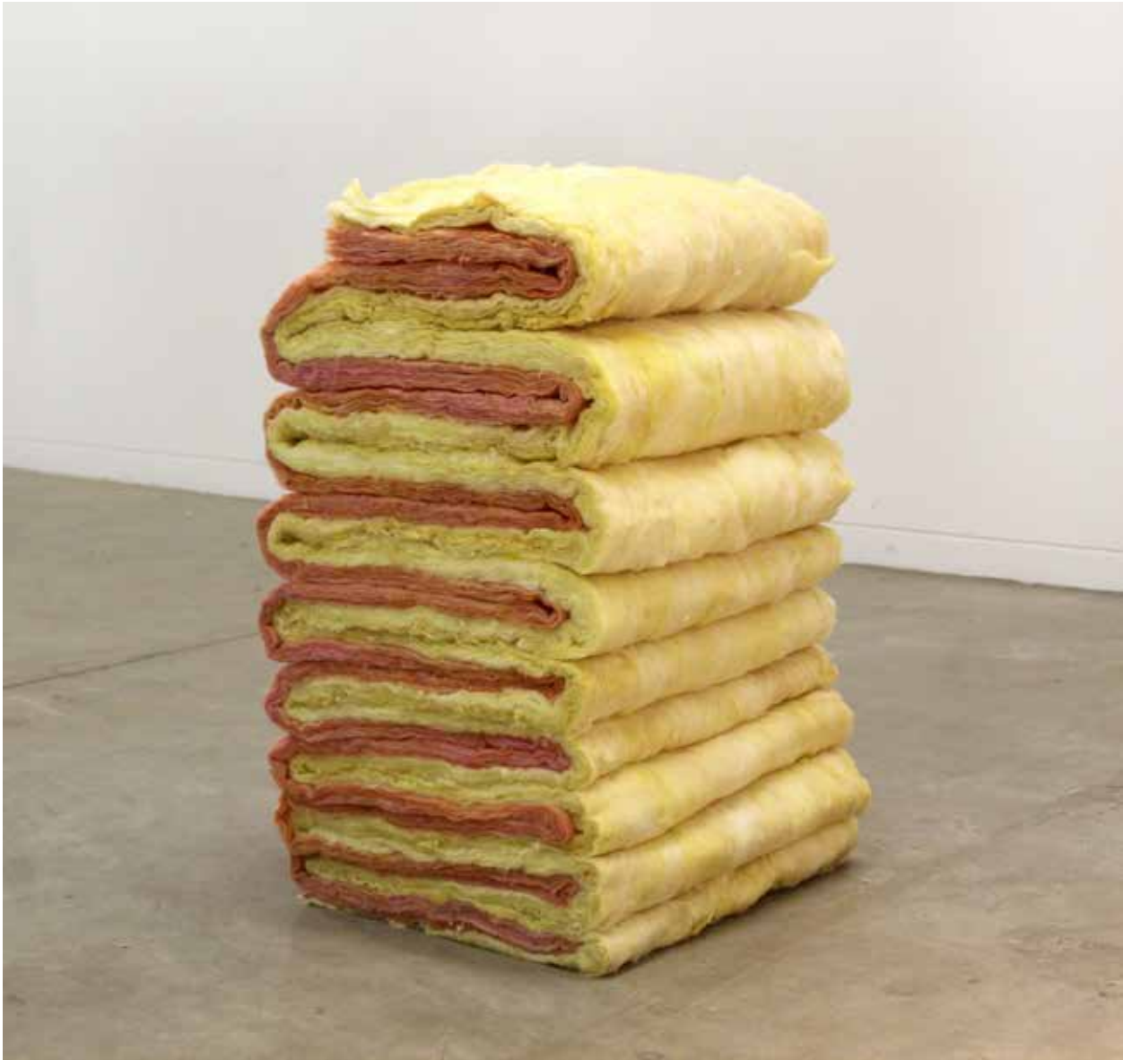
Figura 3: "El amor no basta" (2019). Lana de vidrio. 90 x 60 x 46 cm.