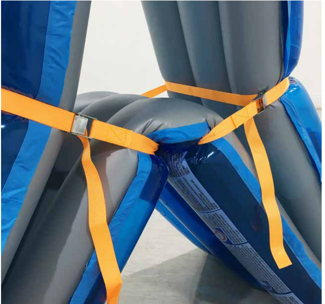
Figura 6: "Bueno para nada" (2019). Piscina inflable, eslingas. 130 x 60 x 150 cm.