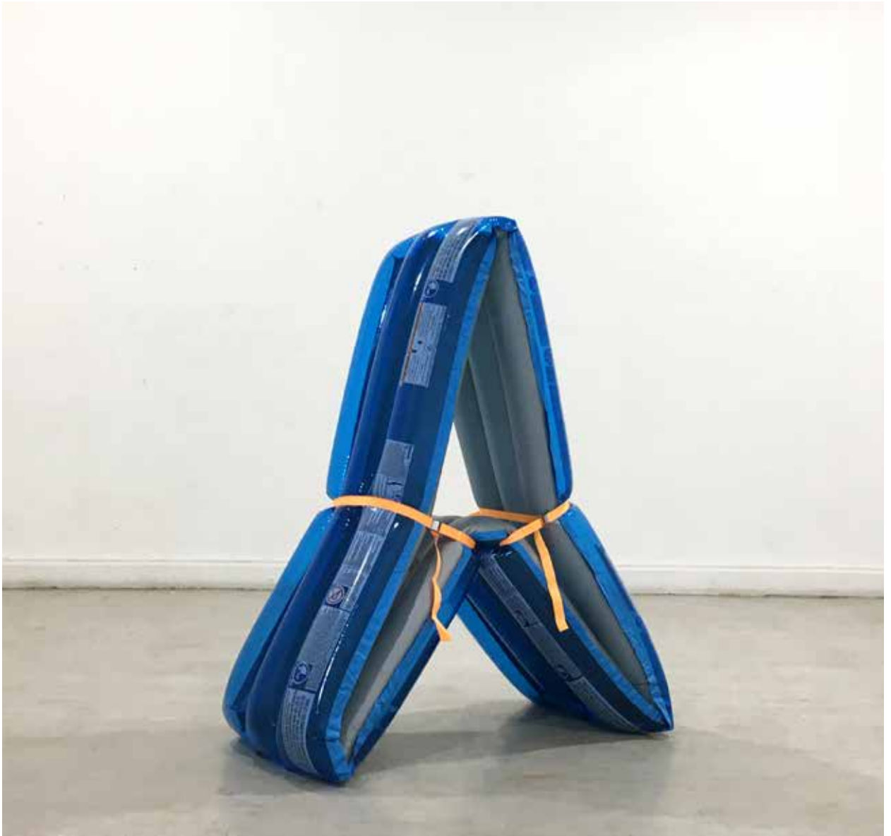
Figura 5: "Bueno para nada" (2019). Piscina inflable, eslingas. 130 x 60 x 150 cm.