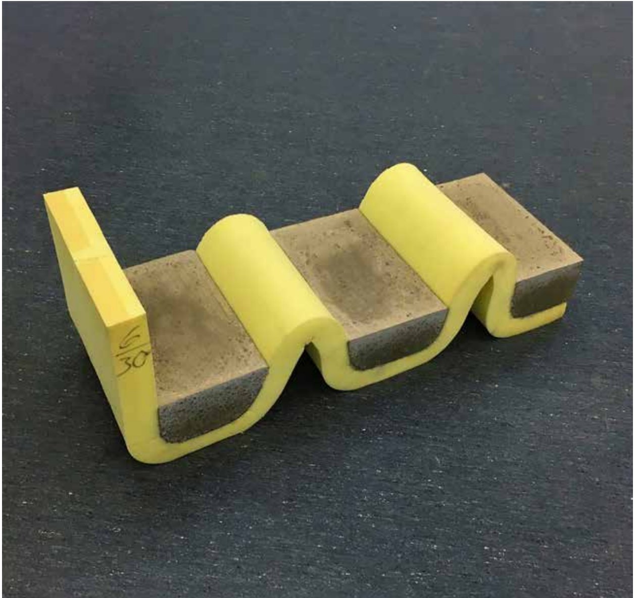
Figura 2: "Te da lo mismo" (2017). Espuma, concreto. 110 x 40 x 35 cm.