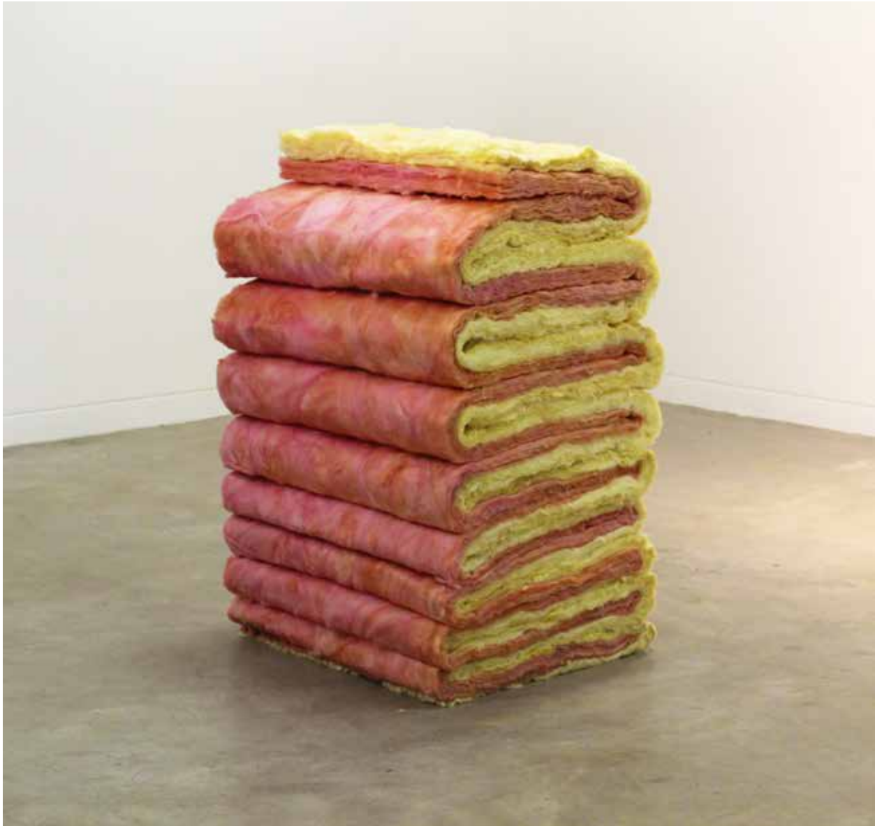
Figura 4: "El amor no basta" (2019). Lana de vidrio. 90 x 60 x 46 cm.