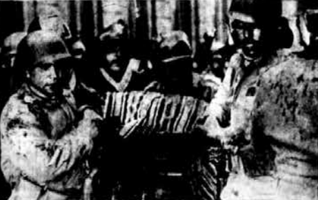
La multitud que se reunió en el centro de Valparaíso, el día de la muerte de Salvador Allende. Fue el mismo sector el interior donde Allende tuvo por planes de los "voluntarios" de la FACH.