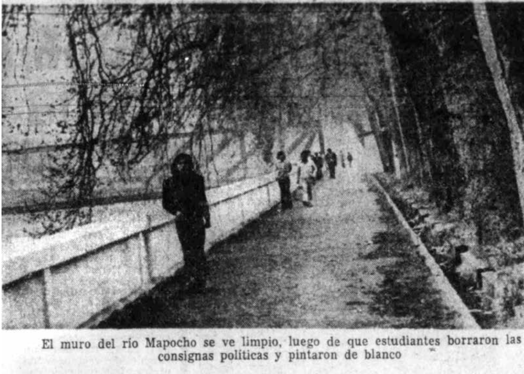
Figura 5: "Nuevo rostro con calles limpias y ordenadas" (29 de septiembre, 1973). El Mercurio , p. 29. Figure 5: "Nuevo rostro con calles limpias y ordenadas" [New face with clean and orderly streets] (1973, September 29 th ). El Mercurio , p. 29.