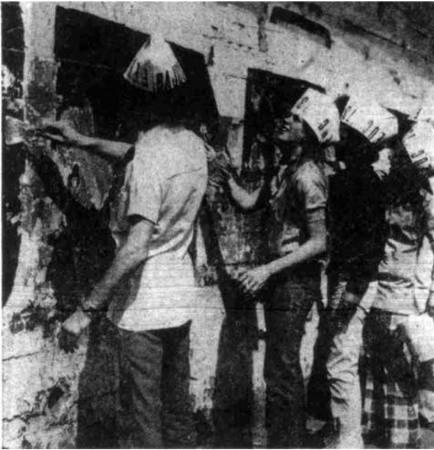
Figura 4: "Con gran entusiasmo cientos de jóvenes han proseguido la tarea de limpiar los muros de la ciudad de toda clase de leyendas políticas" (22 de septiembre, 1973). El Mercurio , p. 17. Figure 4: "Con gran entusiasmo cientos de jóvenes han proseguido la tarea de limpiar los muros de la ciudad de toda clase de leyendas políticas" [With great enthusiasm, hundreds of young people have continued the task of cleaning the city walls of all kinds of political slogans] (1973, September 22 nd ). El Mercurio , p. 17.