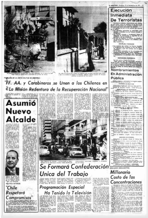
Figura 2: "En todos los barrios de la capital se registró ayer una gran actividad para volver a dar a la ciudad un aspecto de limpieza" (16 de septiembre, 1973). El Mercurio, p. 17. Figure 2: "En todos los barrios de la capital se registró ayer una gran actividad para volver a dar a la ciudad un aspecto de limpieza" [In all the capital's neighborhoods, there was a great activity yesterday to give the city a clean aspect again] (1973, September 16 th ). El Mercurio, p. 17.