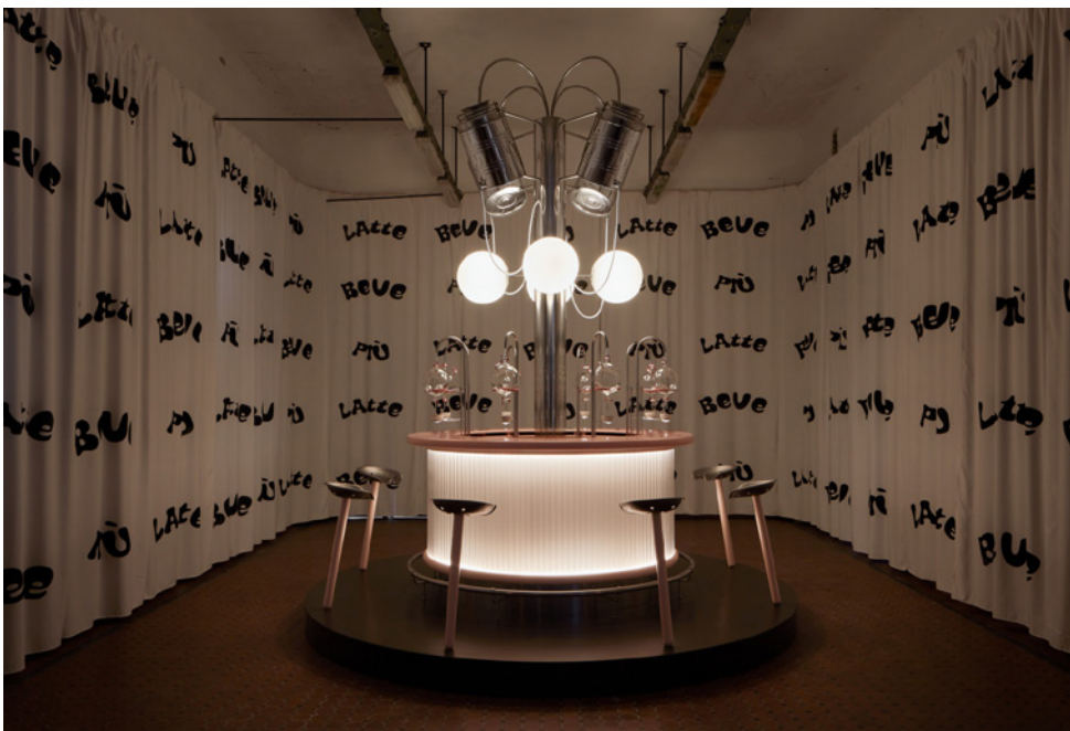
FIGURAS 4-5 Milk Bar. Semana del Diseño de Milán, 2021. Responsables de proyecto: India Mahdavi, Youri Kravtchenko; Escenografía: Lolita Gomez, Blanca Algarra, estudiantes HEAD – Genève.

FIGURES 4-5 Milk Bar. Milan Design Week, 2021. Project leaders: India Mahdavi, Youri Kravtchenko; Scenography: Lolita Gomez, Blanca Algarra, students HEAD – Genève.