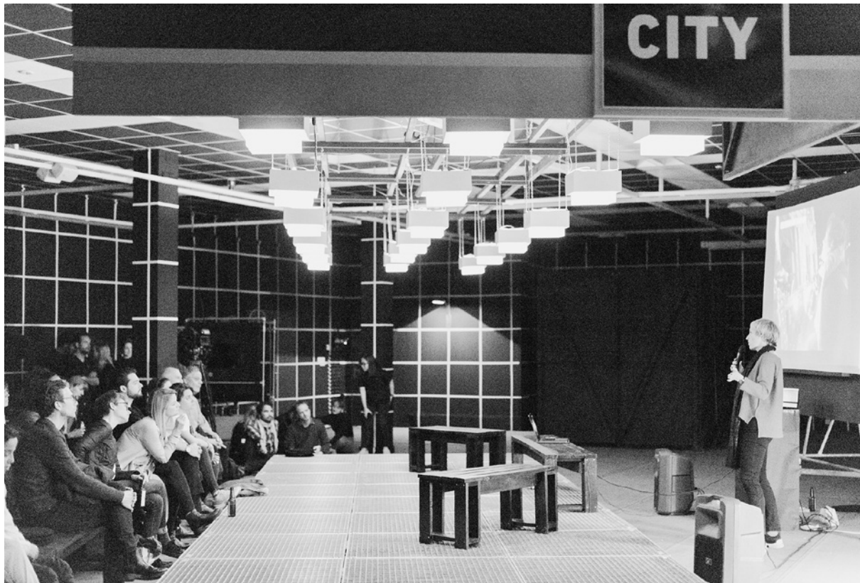
FIGURA 3 Scènes de Nuit . Exposición nocturna en F'ar Lausanne, 2019. Curadores: Javier F. Contreras, Youri Kravtchenko; Asistente: Manon Portera; Escenografía: estudiantes HEAD – Genève.

FIGURE 3 Scènes de Nuit . Nocturnal Exhibition at F'ar Lausanne, 2019. Curators: Javier F. Contreras, Youri Kravtchenko; Assistant: Manon Portera; Scenography: students HEAD – Genève.