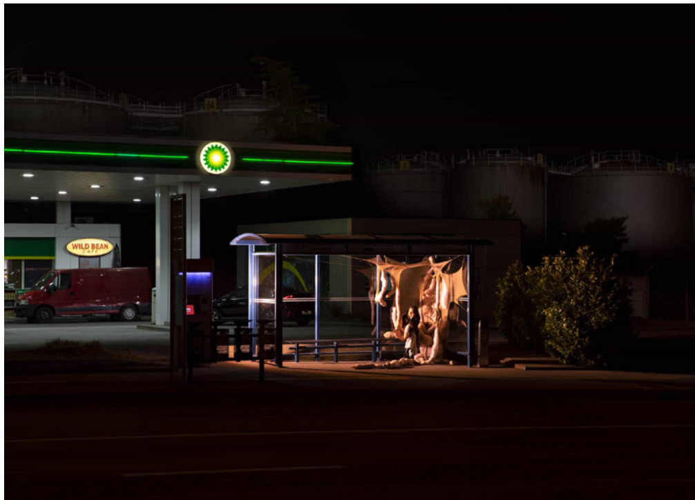
FIGURA 10 Des Corps dans la Nuit , 2022. Responsables de Workshop: Paule Perron, Julien Lafontaine; estudiantes HEAD — Genève.

FIGURE 10 Des Corps dans la Nuit , 2022. Workshop leaders: Paule Perron, Julien Lafontaine; students HEAD — Genève.