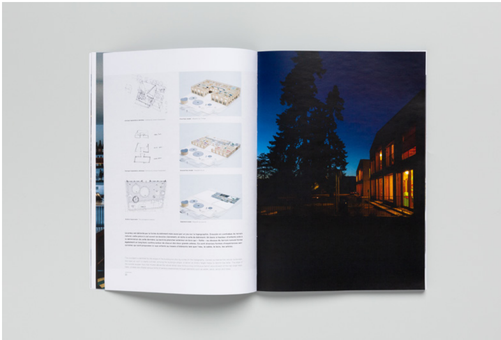
FIGURAS 8-9 El Croquis Night , 2020. Concepto: Javier F. Contreras; Responsable de Workshop: Richard Levene; Edición: estudiantes HEAD – Genève.

FIGURES 8-9 El Croquis Night , 2020. Concept: Javier F. Contreras; Workshop leader: Richard Levene; Edition: students HEAD – Genève.