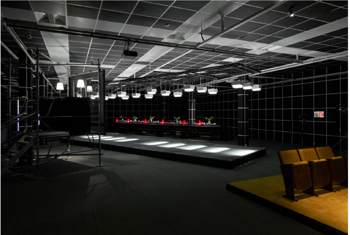
FIGURA 2 Scènes de Nuit . Exposición nocturna en F'ar Lausanne, 2019. Curadores: Javier F. Contreras, Youri Kravtchenko; Asistente: Manon Portera; Escenografía: estudiantes HEAD — Genève.

FIGURE 2 Scènes de Nuit . Nocturnal Exhibition at F'ar Lausanne, 2019. Curators: Javier F. Contreras, Youri Kravtchenko; Assistant: Manon Portera; Scenography: students HEAD — Genève.