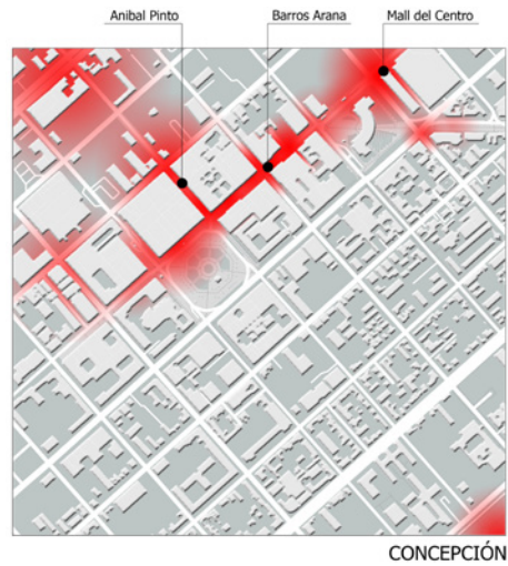
FIGURA 1 Mapa de lugares del centro donde se identifica concentración de comercio informal en la ocupación del espacio público en Guayaquil, Tacna y Concepción.