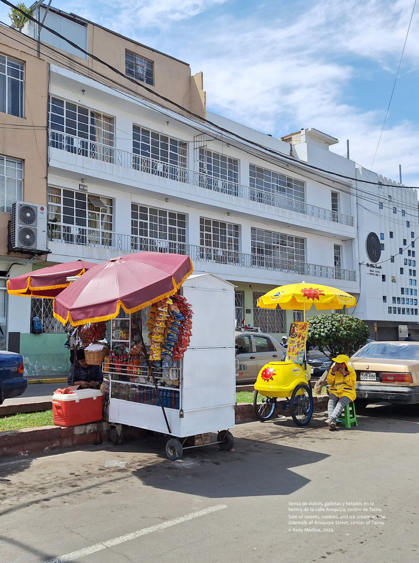
Venta de dulces, galletas y helados en la berma de la calle Arequipa, centro de Tacna. Sale of sweets, cookies, and ice cream on the sidewalk of Arequipa Street, center of Tacna.