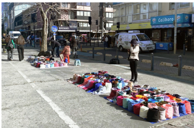
FIGURA 2 (arriba) Comercio en la calle principal Barros Arana, centro de Concepción.

FIGURE 2 (above) Informal trade on the main street, Barros Arana, center of Concepción.