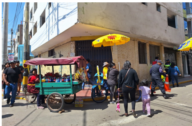
FIGURA 5 (arriba) Venta de dulces, galletas y helados. Ocupación de parte de la calle Arequipa, alrededores de la catedral de Tacna.

FIGURE 5 (above) Sale of sweets, cookies, and ice cream. Occupation of part of Arequipa Street, around the Cathedral of Tacna.